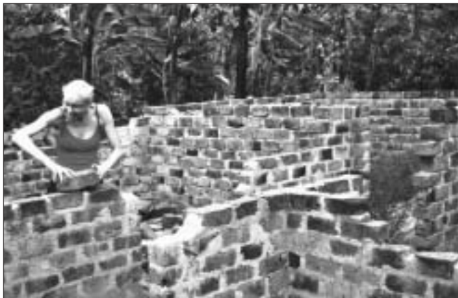
Byggeriet af Marias nye hus er gået i stå.

Risikoen for at noget af dette kunne være sket er stor i et land som Uganda. Havde jeg lyst til at sætte mit vellykkede førsteindtryk på spil ved denne rejse? Men det var jo netop derfor, jeg i sin tid havde ønsket at rejse som volontør. Jeg ønskede jo at få så oprigtigt et indtryk af et andet folk, som man nu kunne få på 4