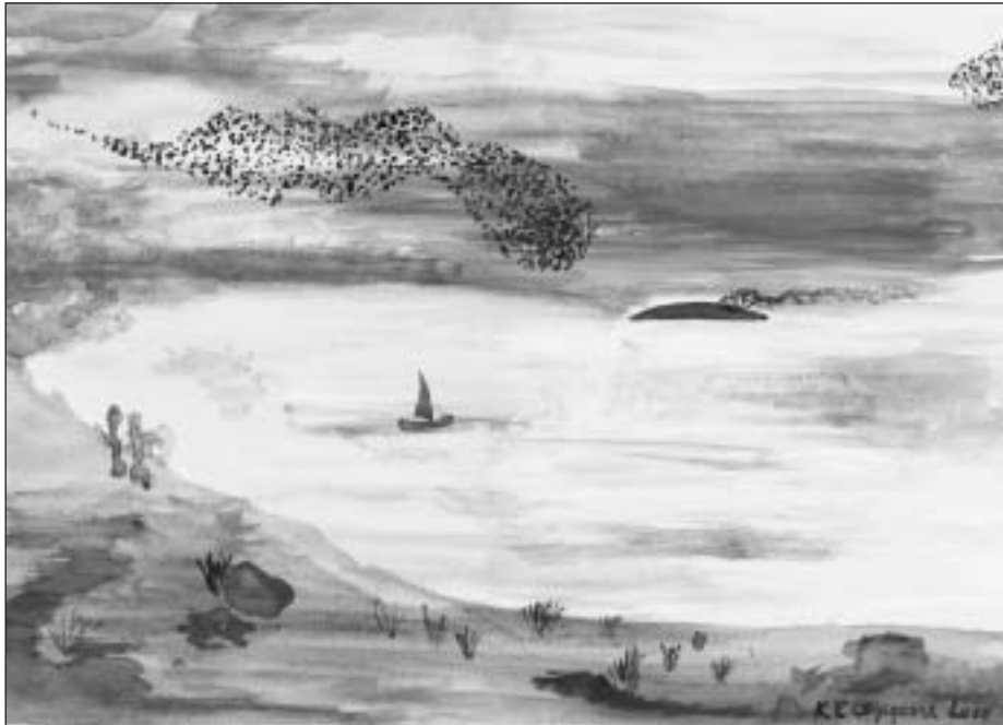
K. E. Lægsgaard: Sort Sol . 2000.

på at Gud kan og vil gøre hvert eneste af de mennesker, vi bærer til graven med gråd, til salige, lykkelige i Guds rige, så er afskeden, om blot for en tid, hos rige og fattige, hos landevejens færende - og arveprinsener og prinsesser - hos gode og onde, hos mennesker med og uden tro på Gud, så er afskeden - kort eller lang - ikke til at lære - ikke til at bære. Døden er godt mediestof, fordi forladthed er ubærlig. Sorg kan aldrig behandles som andet end en kærlighed, der er blevet hjemløs, det er det, der gør den ubærlig for os hjemmeføddinger, der elsker - også livet.