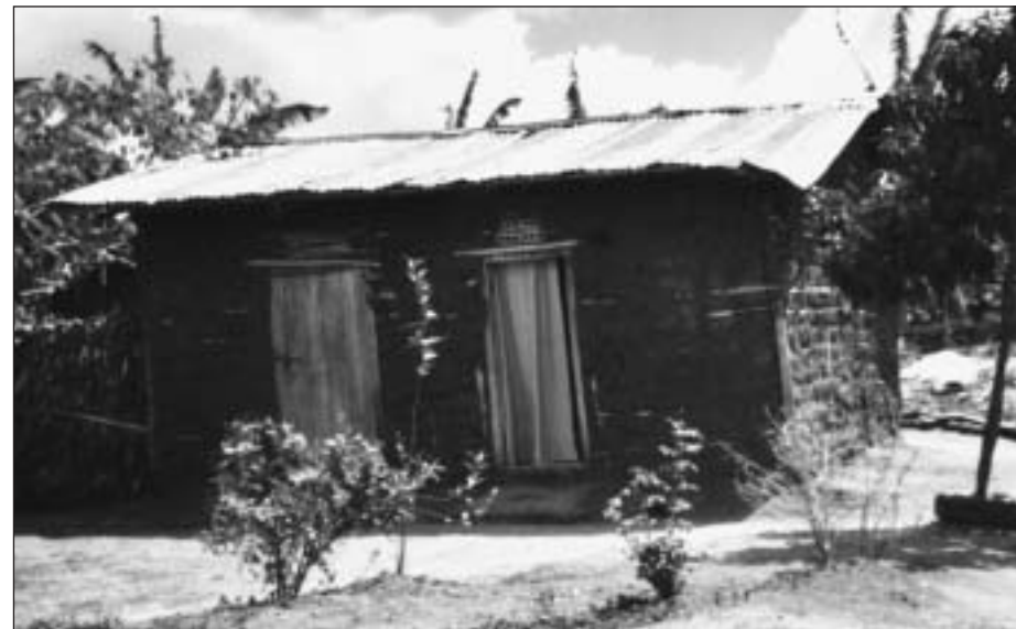
Marias hus i Kisaayi. Her bor 6 mennesker.

Da jeg endelig genså dem, var jeg ikke længere i tvivl om, hvorfor jeg havde ønsket at komme tilbage. Gensynsglæden var stor, og jeg må indrømme, at der græd jeg! Heldigvis var den umiddelbare status, at alle havde det godt. Vi havde valgt at tilbringe 5 dage hos familien, og