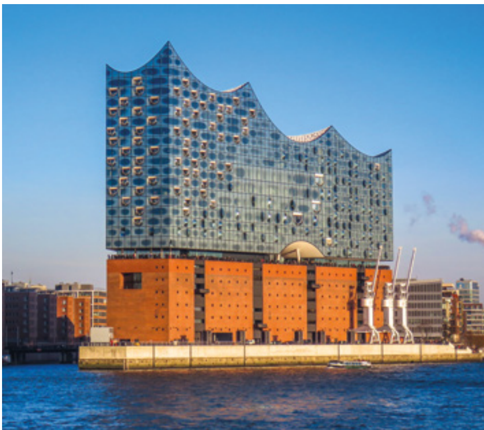
Elbphilharmonien blev påbegyndt i 2007 og forventedes færdig i 2010, men blev først indviet i 2017. Den røde bygning nedenunder er et varehus, som blev bygget i 1963, og så har man aldeles utraditionelt valgt at bygge Elbphilharmonien ovenpå.

Det kan man jo selvfølgelig ikke vide, men dirigenten Sir John Eliot Gardiner fyldte 80 år ugen efter, og han regnes som den førende specialist i Bachs store værker i denne verden. Mon ikke han har villet fejre sin fødselsdag med det værk, som også for ham er "værket over dem alle". Det var hans eget orkester og hans eget kor, der fremførte musikken, som var Johann Sebastian Bachs messe i h-mol.