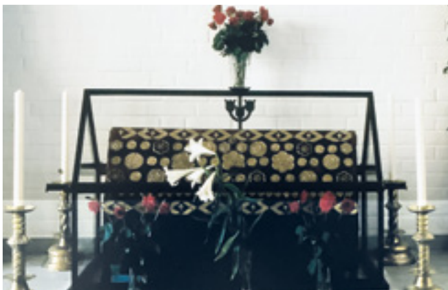
Birgittas sarkofag, som den står i dag i Vadstena Klosterkirke.

Derefter – og således oplivet og opmuntret på sjæl og legeme - indbyder Birgittaforeningen til en lille vandring i Munkholm anlægget. Undervejs vil Birgittas fortælling blive fortalt og underbygget af svensk visesang.