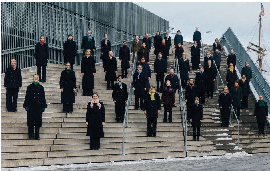
SORA er et nyetableret kor, der forener to i forvejen fremragende kor: Aarhus Pigekor, som sidste år kunne fejre 20 års jubilæum, og koret EVE. Koret synger lifligt ved en koncert søndag d. 14. april kl. 15:00 .