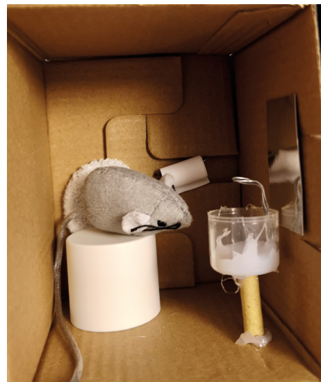
Musetoilet kreeret af Saga 😊